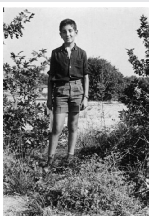
Καλημέρα Ζωή! (1962) Θεέ μου ας μη το ξεχάσω ποτέ! αυτό το παιδί.

κιάλας, ενώ αυτή την αυγουσιática φτώχεια που μας χωράει όλους σαν ξενοδοχείο τρίτης κατηγορίας τη λατρεύω, με βοηθά να είμαι καλλιτέχνης, όπως με δέχεται ορθάνοιχτη λόγω ζέστης, αναγνωρίζοντάς με σαν δικό της παιδί με όλα μου τα πρόσωπα.