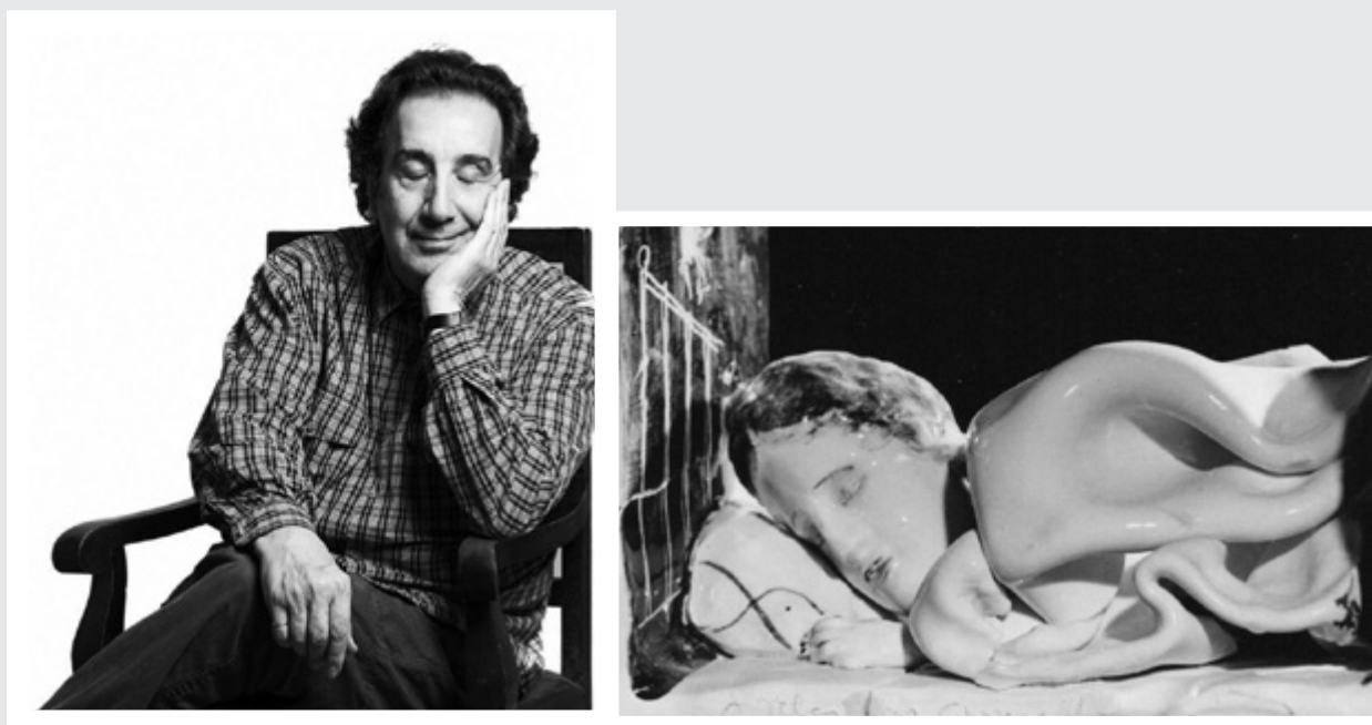
Όνειρα και ομιλούσες φωτογραφίες.