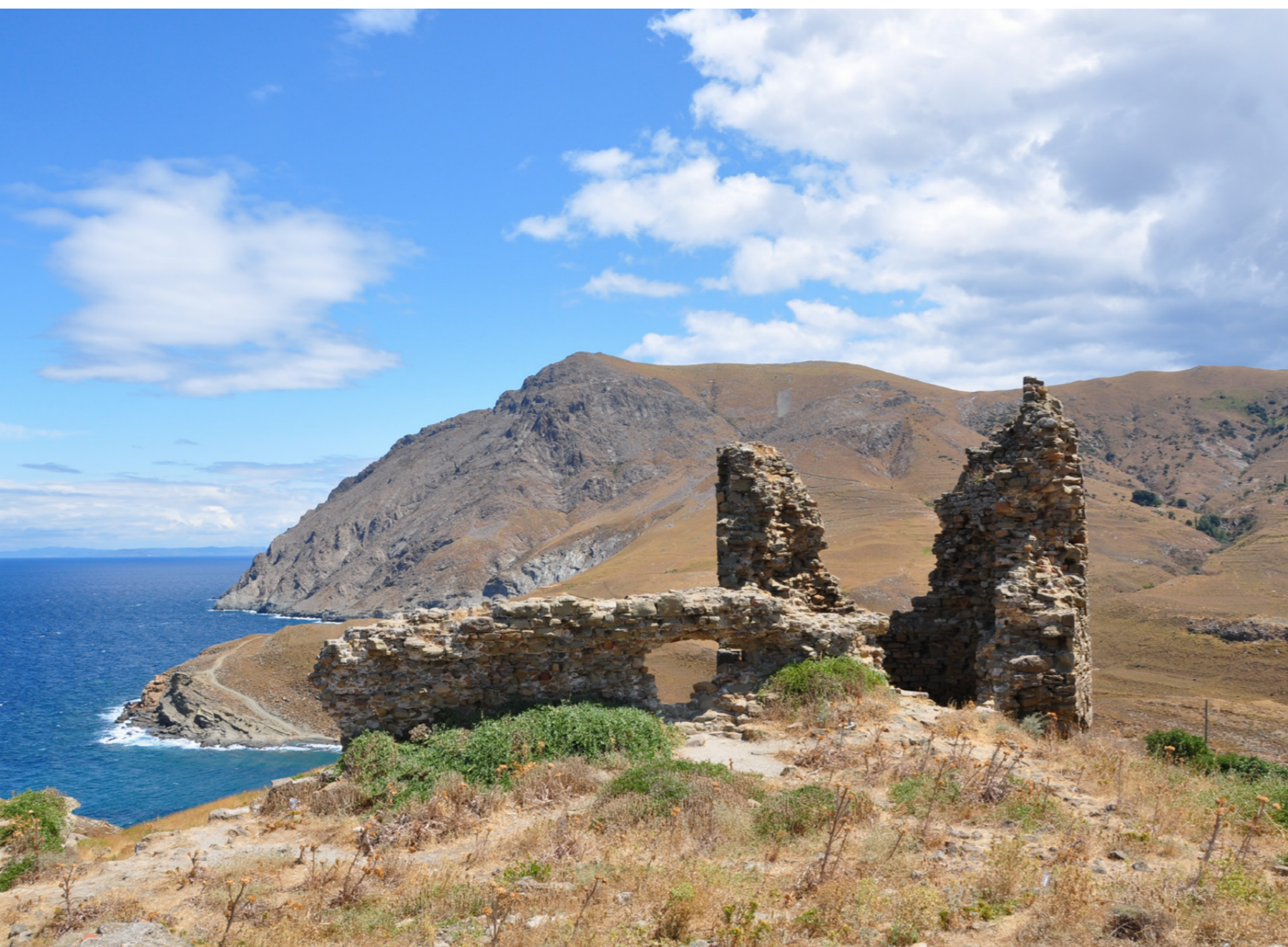
Κάστρο, τμήμα του βυζαντινού τείχους

Τα ακριβώς χρονολογημένα εκκλησιαστικά έργα που παρουσιάζονται εδώ δεν ανάγονται πριν από τις πρώτες δεκαετίες του 17ου αιώνα, με μια μοναδική εξαίρεση: δύο δεσποτικές εικόνες που βρίσκονται στον ενοριακό ναό της Αγίας Βαρβάρας στο Ευλάμπιο, οι οποίες χρονολογούνται πιθανώς μεταξύ 15ου και 16ου αιώνα 1 . Από την άλλη πλευρά, οι σωζόμενοι ενοριακοί ναοί της Ίμβρου είναι ακόμη μεταγενέστεροι, αφού η παλαιότερη εκκλησία, ο Άγιος Γεώργιος στον οικισμό των Αγίων Θεοδώρων, έχει ανεγερθεί τις τελευταίες δεκαετίες του 18ου αιώνα 2 , ενώ τα εκατοντάδες εξωκκλήσια, διάσπαρτα στην ευρύτερη περιοχή των επτά ελληνικών χωριών του νησιού 3 , τουλάχιστον στη σημερινή τους μορφή, είναι κτίσματα των δύο προτελευταίων αιώνων. Το γεγονός είναι περίεργο για ένα νησί που παρουσιάζει συνεχή κατοίκηση καθ' όλους τους