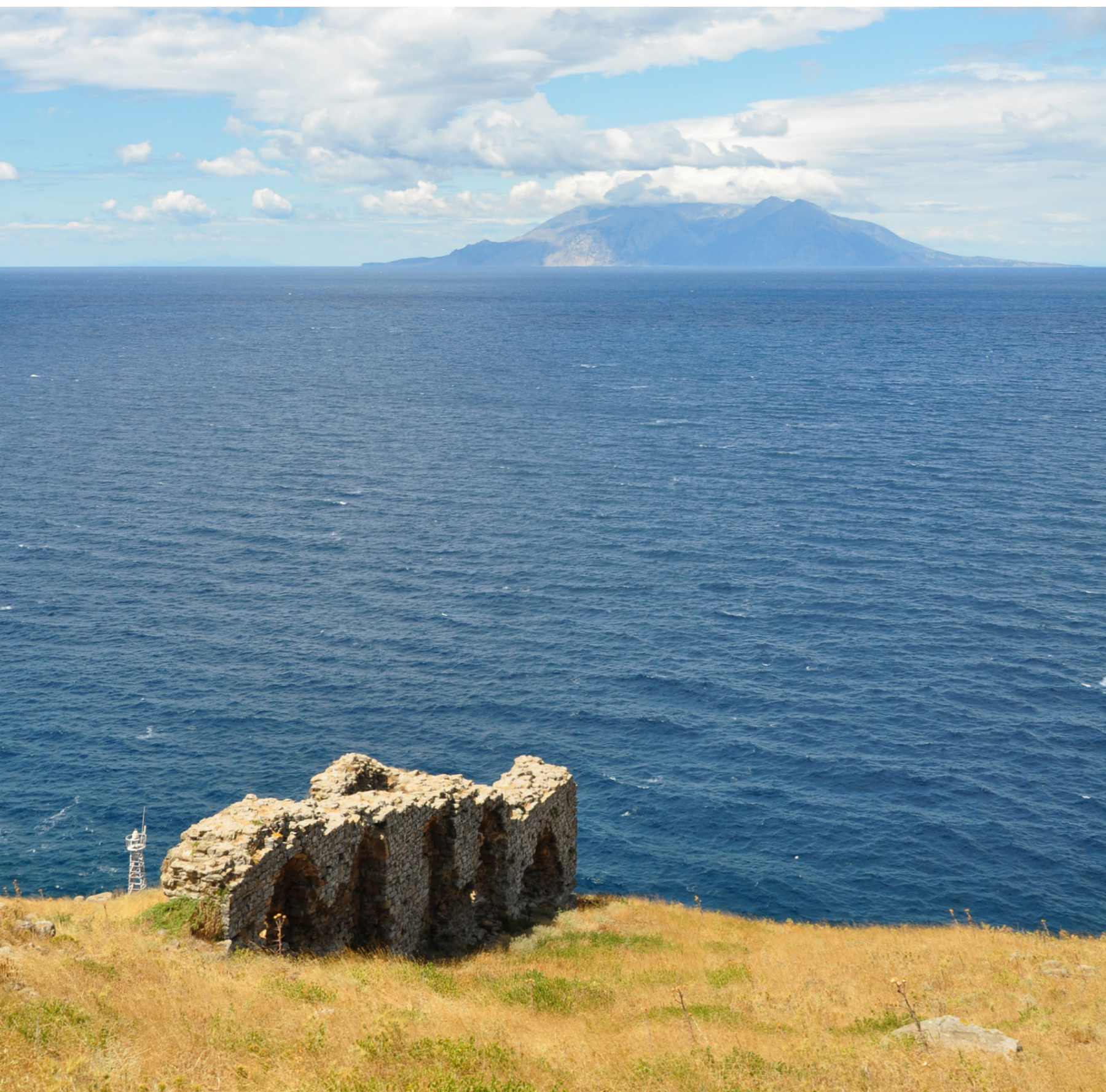
Κάστρο, τμήμα του βυζαντινού τείχους. Στο βάθος η Σαμοθράκη