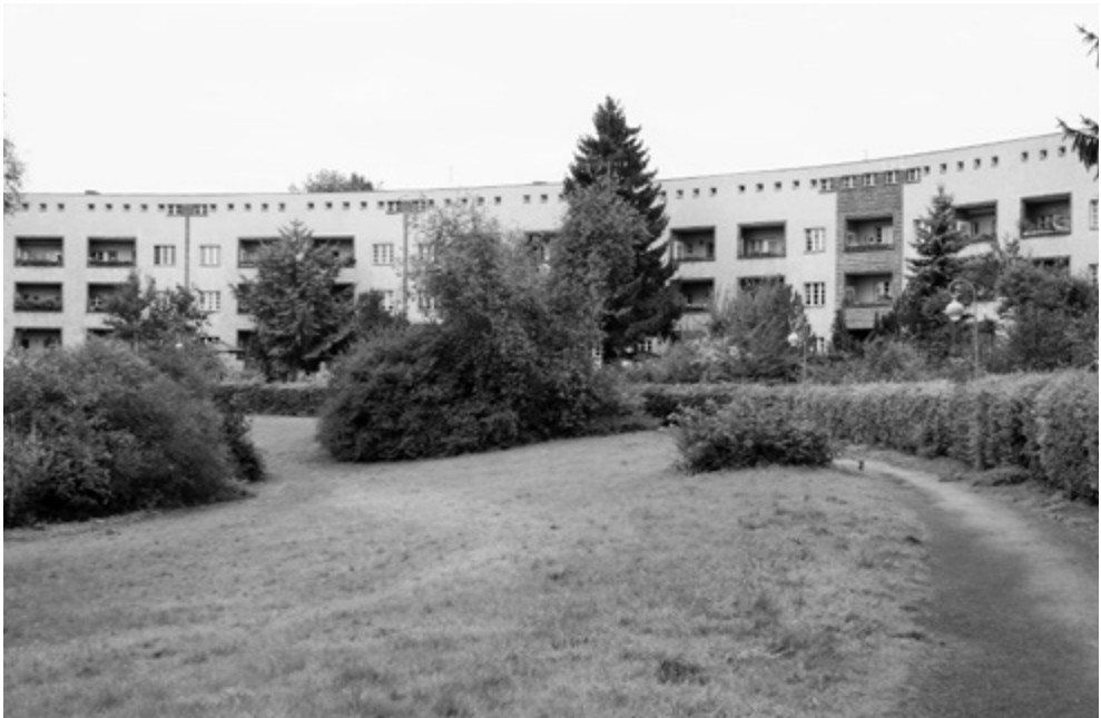
B. Taut, Hufeisensiedlung Britz, Βερολίνο, 1925.