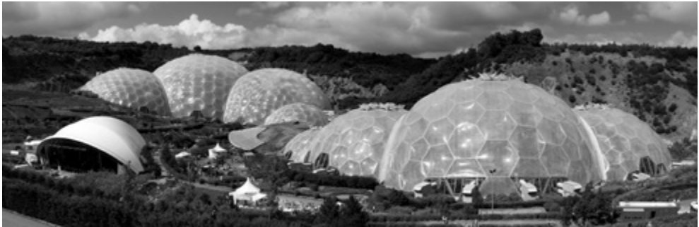
Buckminster Fuller, Dymaxion House/ Eden project.