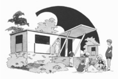
Ateliers Jean Prouvé, Διαφήμιση προκατασκευασμένης μεταλλικής κατοικίας, 1946