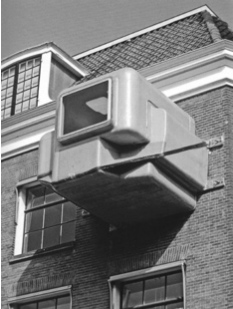
Atelier van Lieshout, Οικιστικό κύτταρο Clip On, 1967.