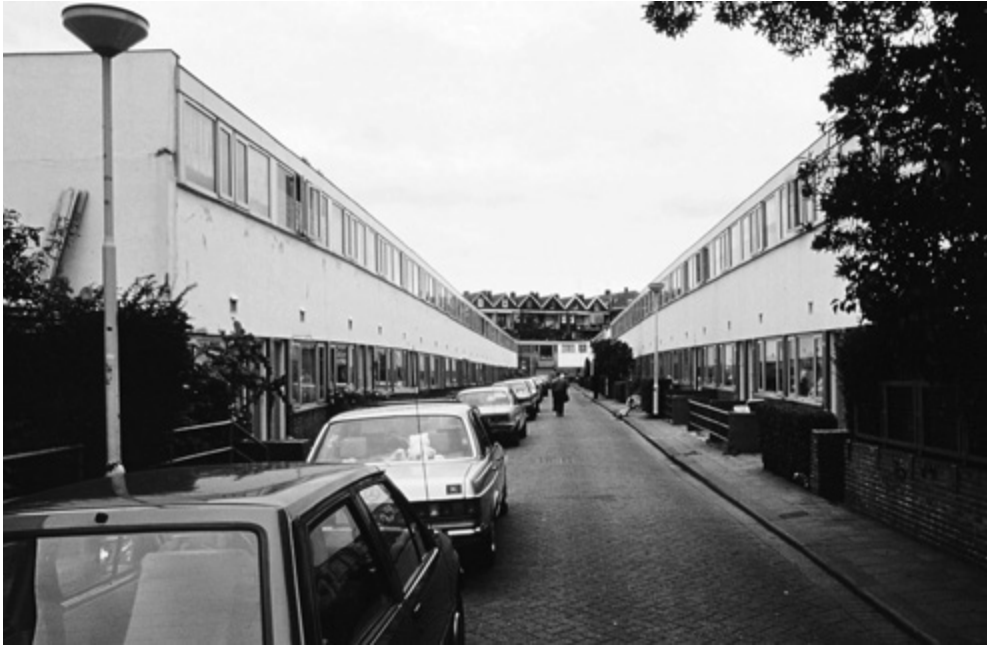
J.J.P. Oud, Kiefhoek, Rotterdam, 1925.