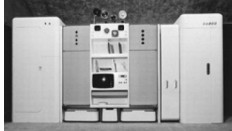
J. Colombo, Total Furnishing Unit, 1972.