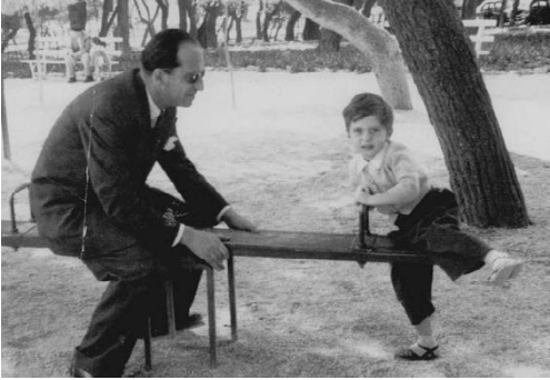
Με τον πατέρα μου.

με κοιτούσαν κάτι συνομήλικά μου κορίτσια να βαφτίζομαι, γυμνός και πάλι, δεν γινόταν αλλιώς, έτσι είναι το τελετουργικό, με τον παπά να με βουτάει στο νερό δίχως οίκτο, αδιαφορώντας πλήρως για το τσαλάκωμα του ανδρισμού μου, μια και στο μυαλό του είχε μόνο το μεροκάματο. Θα το είχα αποφύγει, και μάλιστα θα είχα σύμμαχο τον πατέρα μου που δεν χώνευε ούτε θρησκείες, ούτε παπάδες, γι' αυτό άλλωστε τους κουβάλησε με την κολυμπήθρα στο σπίτι μας, στην οδό Διδότου, τάχα μου δήθεν «το παιδί έχει πρόβλημα με το κρύο», «έχει περάσει ωτίτιδα», άλλη λέξη τρομερή, όσο και η λέξη «σύφιλη» που έμαθα στην εφηβεία μου ή η λέξη «aids» που εισήχθη πολλά χρόνια αργότερα, αλλά δέχτηκα, τελικά, να βαφτιστώ, διότι η αδερφή μου που είχε ήδη βαφτιστεί και μάλιστα σε εκκλησία, με φώναζε «Εβραίο» και δεν μου άρεσε, γιατί είχα ακούσει ότι οι Εβραίοι είχαν σταυρώσει τον Χριστό.