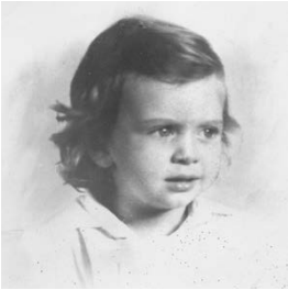
Βρέφος - χωρίς ξεκάθαρες απόψεις.

ΠΟΛΛΑ ΧΡΟΝΙΑ αργότερα, οι γονείς μου μού είπαν ότι γεννήθηκα στο «Μαιευτήριο Αλεξάνδρα», στη Βασιλίσσης Σοφίας, σχεδόν στο κέντρο της Αθήνας – τότε ήταν εξοχή, δεν υπήρχε αυτό το ωραίο κτήριο της Αμερικάνικης Πρεσβείας, κτισμένο από τον Βάλτερ Γκρόπιους, ούτε το άλλο, το τέρας, το Μέγαρο