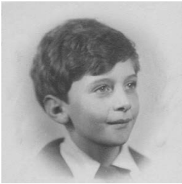
Επτά ετών - με απόψεις.

Η ΞΕΝΙΑ δεν ήταν η μόνη ξανθιά με την οποία είχα μπλεξίματα. Στα πέντε μου είχα ερωτευτεί την Αλίκη Βουγιουκλάκη. Ντρέπομαι λιγάκι που το λέω, κουλτουριάρης άνθρωπος, αλλά, τέλος πάντων, κάτι το νεαρόν της ηλικίας, κάτι αυτός ο καημός της ελληνικής αστικής τάξης να ξεφύγει από τις μνήμες