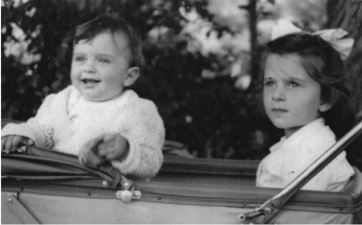
Με την αδερφή μου.

Πολλά χρόνια νωρίτερα, είχα αναγκαστεί να πω άλλα στον ψυχαναλυτή μου που δεν καταλάβαινε γρι από άστρα. Ευτυχώς ήταν της κλασικής σχολής –(αντιβάνι) είναι ο επιστημονικός όρος– με έβαζε ξαπλωτό ανάσκελα κι αυτός καθόταν πίσω μου, έτσι δεν είχα να αντιμετωπίσω κάποιο σοφό διαπεραστικό βλέμμα σ' αυτήν την περίπτωση, κι εγώ, που είχα στο μεταξύ διαβάσει όλον τον Φρόιντ και τον μισό Λακάν (ο άλλος μισός έτσι κι αλλιώς δεν διαβάζεται), του αράδιαζα κάτι για τη νοσοκόμα «που με είδε γυμνό την ώρα της γέννας», «ήταν ξανθιά με μεγάλο στήθος», «αισθάνθηκα ντροπή που με είδε έτσι, στα μαύρα μου τα χάλια», και άλλα πολλά που ένιωθα ότι ένας ψυχαναλυτής θέλει να ακούσει, παράξενο, γιατί εγώ πλήρωνα, όχι εκείνος, και μάλιστα αρκετά.